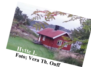
Hytte 1.