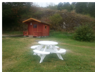
Litt av lekeplassen