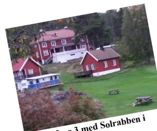
Hytte 2 og 3 med Solrabben i bakgrunn.