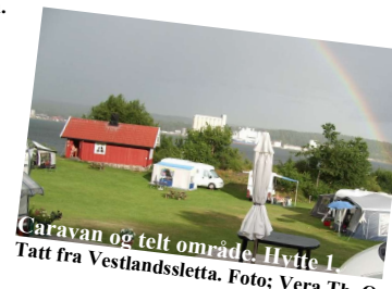
Caravan og telt område. Hytte 1 Tatt fra Vestlandssletta.