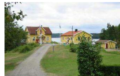
Resepsjon med Sommerstua. Sjøhaughuset og toiletthuset med badstu.