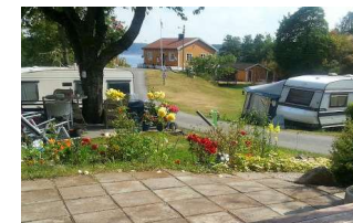
Utsikt mot resepsjon og lekeplass fra Vestlandssletta.