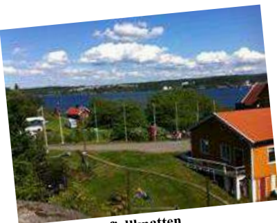
Utsikt fra fjellknatten

VI ØNSKER DEG ET HYGGELIG OPPHOLD HER PÅ SJØHAUG.