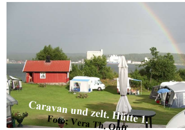
Caravan und zelt, Hütte 1.