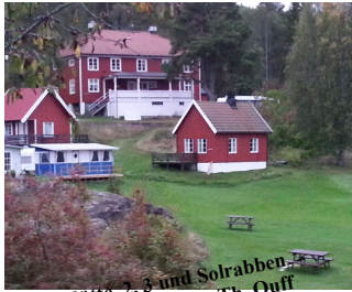
Hütte 2, 3 und Solrabben.