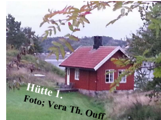
Hütte 1.