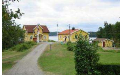
Sommerstua, Rezeption mit Gemeinschaftshaus, Sjøhaughuset und Sanna/Toiletten