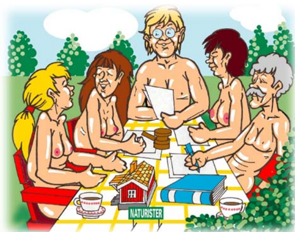
Teckning: Börje Fransson

Vi ska också som vanligt välja två revisorer och en revisorssuppleant på vardera ett år samt förstås en valberedning på tre personer.