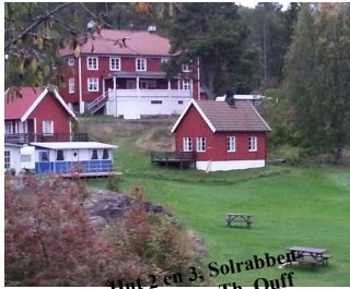
Hut 2 en 3, Solrabben