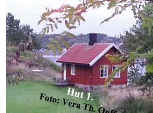
Hut 1.