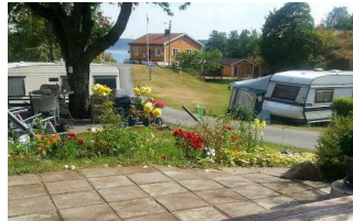
Receptie, Vestlandsletta.